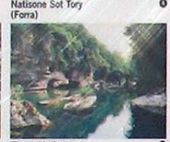
Natissone Sot Tory (Forra)