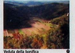
Veduta della bonifica dal monte Purgissimo