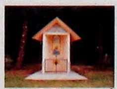
Maina della Bonifica (costruita nel 1963 dopo le operazioni di bonifica)