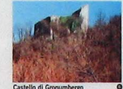
Castello di Gronumbergo (risalente all'anno 1000 circa)