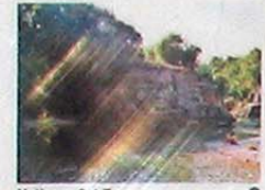
Capitello zona del guado (collegamento fra Gronumbergo e Guspergo)