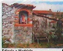
Edicola a Madriolo (punto di sosta al tempo delle rogazioni)