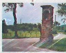
Capitello a Madriolo (punto di sosta al tempo delle rogazioni)