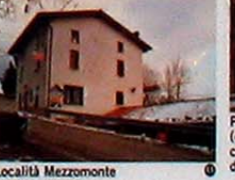
Località Mezzomonte (antica osteria)