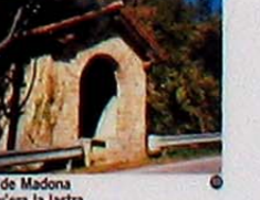
Pi de Madona (dov'era la lastra con l'impronta del piede della Madonna)