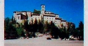
Castelmonte, santuario di culto Mariano